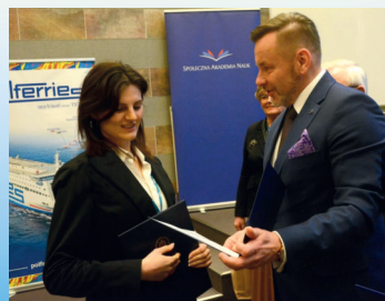
Uczestniczki I Olimpiady Umiejętności Hotelarskich i Olimpiady Wiedzy Hotelarskiej